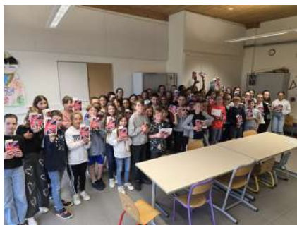
Ecole la Doline