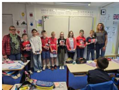
Ecole du Val des Bois