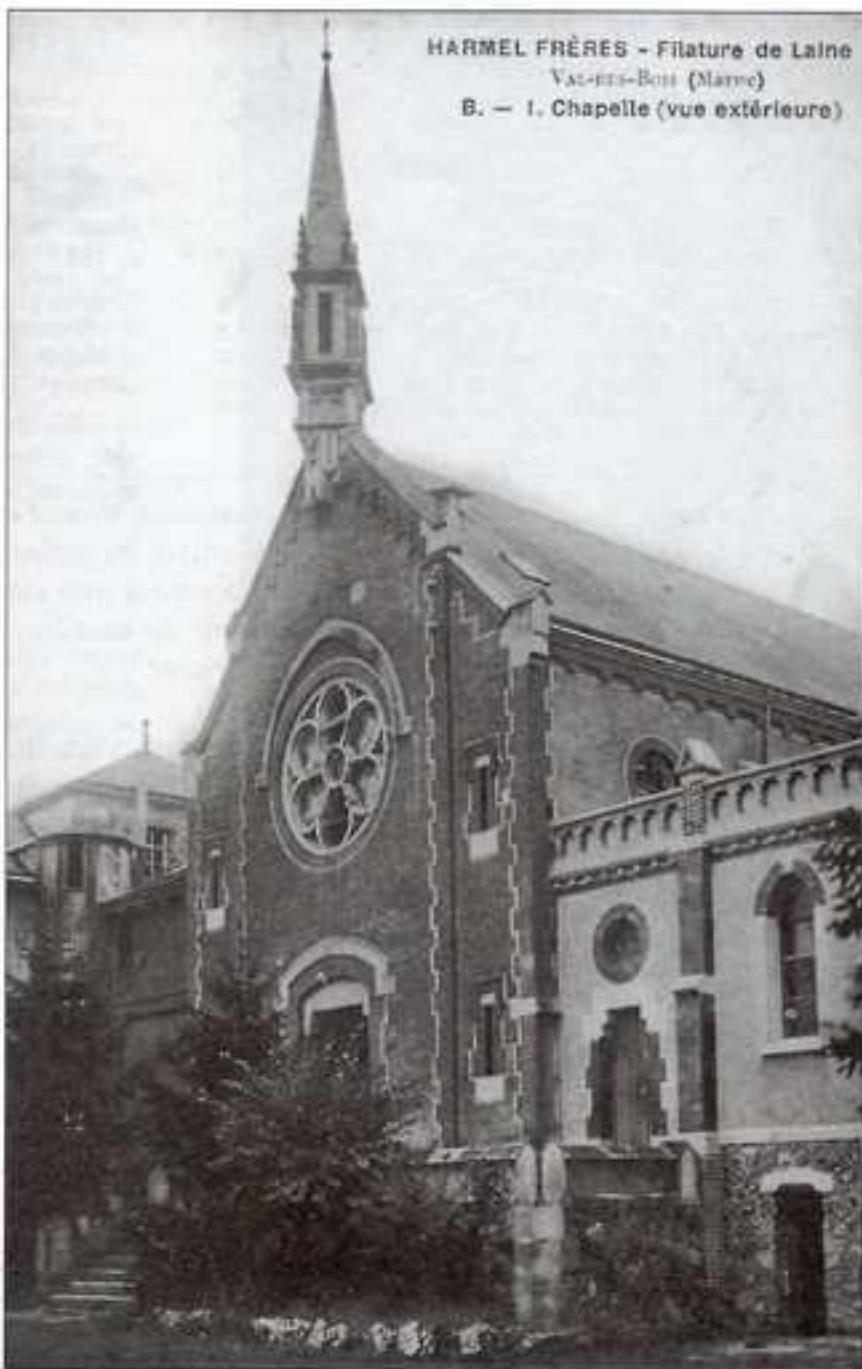
HARMEL FRÈRES - Filature de Laine Val-des-Bois (Marne) B. - 1. Chapelle (vue extérieure)